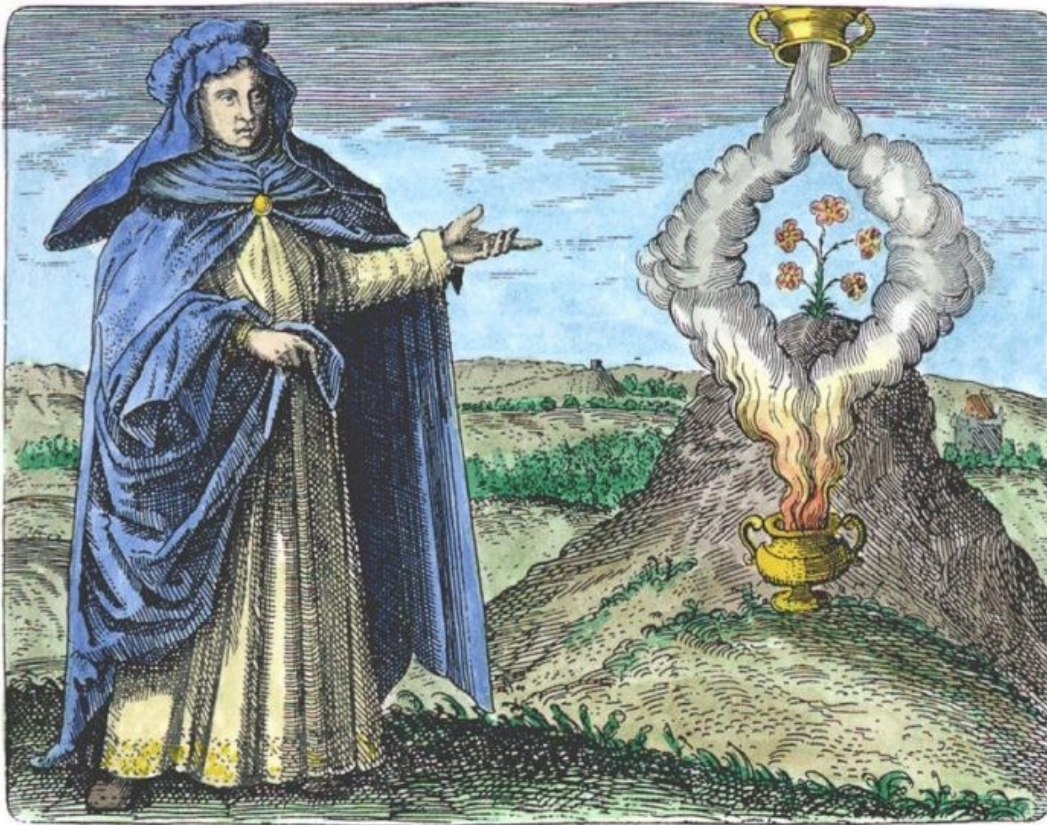
La cabalista Maria la Judía, fundadora de la química moderna. Vivio en Alejandria, Egipto, entre el 1 y el 3er siglo DC. El baño maria se llama así por ella.